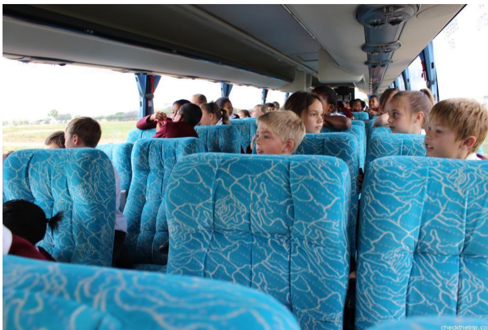
Figura 01 - Alunos em viagem pedagógica