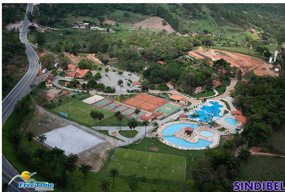
Figura 03 - Clube Free Time localizada na região deste estudo

http://sindibel.com.br/convenio-free-time-sindibel-prorroga-periodo-de-adesao-ate-1302/