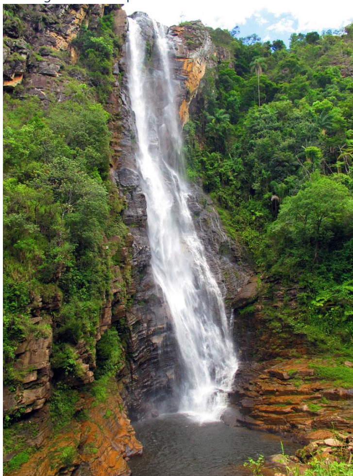
Figura 11 - Parque Estadual da Mata do Limoeiro

http://www.viagemcomemocao.com.br/cachoeiras-na-estrada-real-ipoema/