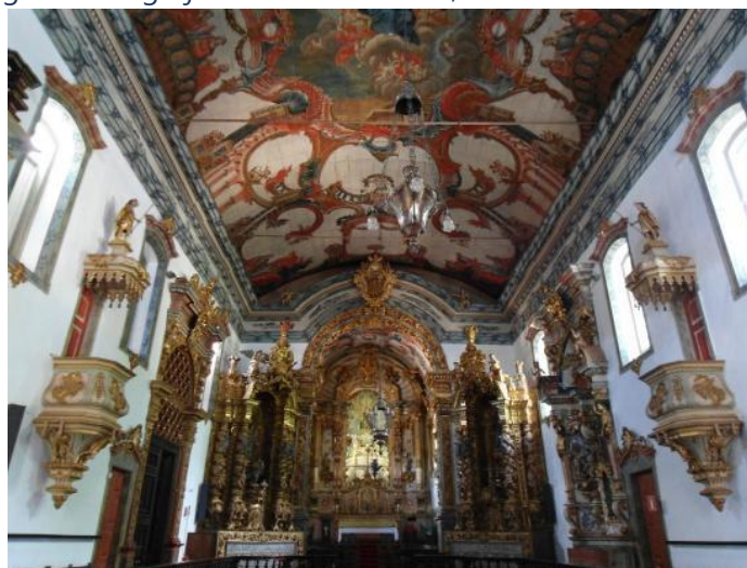
figura 14 - Igreja de Santo Antônio, em Santa Bárbara - MG

https://www.tripadvisor.com.br/LocationPhotoDirectLink-g2348939-d6582563-i155632323-Matriz_De_Santo_Antonio-Santa_Barbara_State_of_Minis_Gerais.html