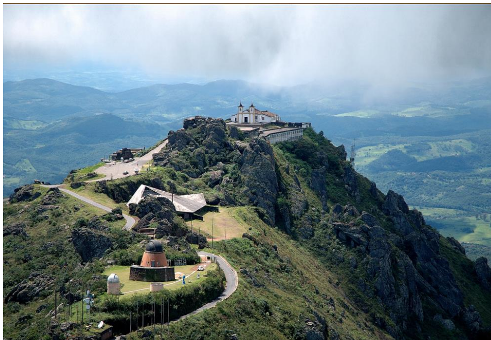
Figura 04 - Serra da Piedade, Caeté