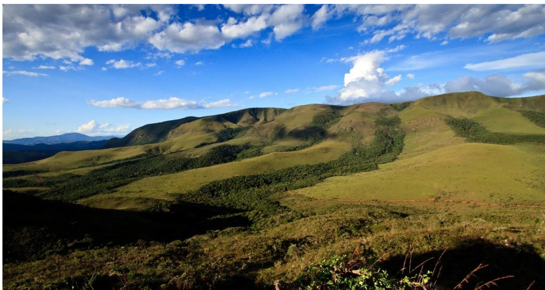
Figura 09 - Parque Nacional Serra do Gandarela

www.dicadaarquitectura.com.br%2F2017%2F06%2Fdoacao-de-mudas-para-acao-de.html&psig=AFQjCNEFSF2FYaA3v-1BJcJ66W72d_j0iw&ust=1504525831652551