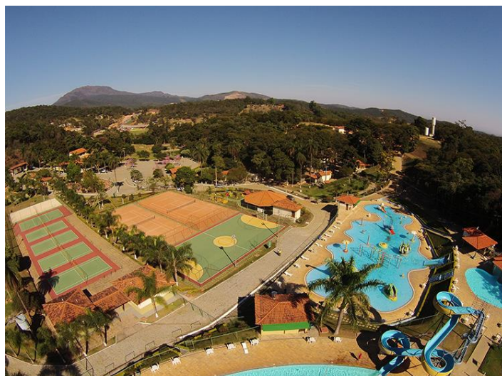
Figura 13 - Complexo de Lazer Free Time, próximo do KM 30

O projeto baseia-se na Infraestrutura já existente no KM 30, nos quais os materiais bibliográficos de que necessitará o aluno-bolsista para a consecução dos objetivos do projeto de pesquisa serão oriundos das bases de pesquisa do KM 30, ou seja, sua Biblioteca Virtual e materiais de referência sugeridos e disponibilizados pelo professor orientador. No que se refere ao aspecto da Infraestrutura (Figura 13) não existente no KM 30, dependendo das atividades a serem desenvolvidos no Projeto, alguns materiais extras podem ser necessários. Contudo, haja vista o previsto engajamento da comunidade com o projeto optar-se-á pelo caráter participativo e colaborativo na aquisição destes materiais. O km 30 deverá passar por ampla reforma e recuperação.