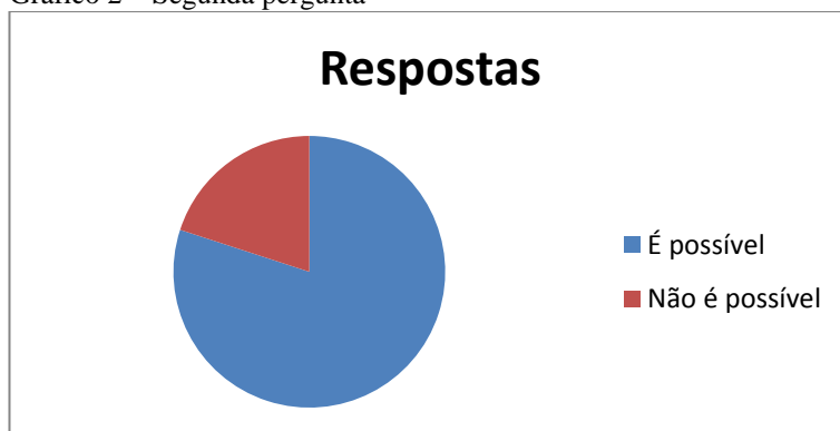
Gráfico 2 – Segunda pergunta

Contudo, aqueles que responderam negativamente afirmaram que não seria possível pelo estado emocional do homem ou que mesmo com o uso da prostaglandina, indutor da ereção, é preciso que haja estímulo porque durante o estresse pelo qual passa o homem, no momento de tensão, faz com que a droga fique pouco tempo dentro do vaso cavernoso em virtude da liberação de adrenalina pelo organismo.