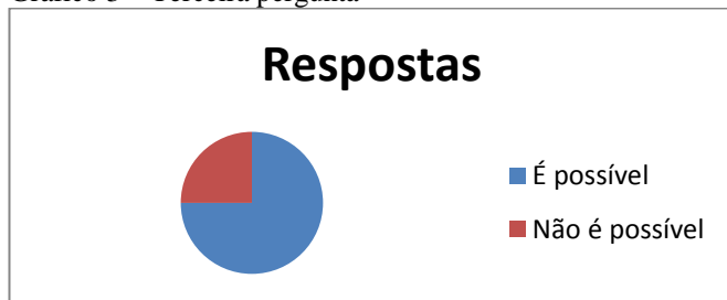
Gráfico 3 – Terceira pergunta

Foi perguntado, também, para aqueles que responderam afirmativamente (oito entrevistados) a alguma das questões anteriores, se na situação descrita poderia ejacular ou atingir o orgasmo (Gráfico 3). Para 75% seria possível atingir o orgasmo ou a ejaculação, para 25% isto não seria possível porque seria necessário que houvesse algum desejo, prazer na situação. Os profissionais que responderam, de forma afirmativa, complementaram que a ejaculação seria consequência natural, se ele teve e manteve a ereção pode ela ocorrer ou que devido ao estresse da situação a ejaculação poderia se dá rapidamente 198 .