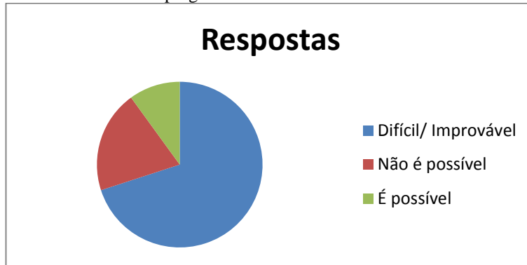
Gráfico 1 – Primeira pergunta

Assim, agrupando-se as respostas “difícil” e “improvável” num único grupo, o resultado é que: para 70% (setenta por cento) dos entrevistados afirmaram ser difícil ou improvável que o homem tenha ereção na hipótese mencionada, 20% (vinte por cento) afirmou que não seria possível e para 10% (dez por cento) é possível o homem atingir a ereção ante aquela situação, conforme gráfico abaixo.