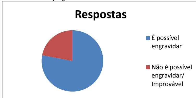
Gráfico 6 – Sexta pergunta